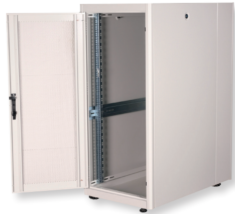
1-Punkt-Verriegelung an allen Türen