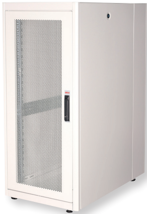
Fronttür aus 70% perforiertem Stahl