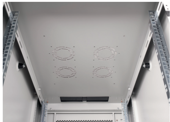
Dach mit Ausstanzungen für Belüftung