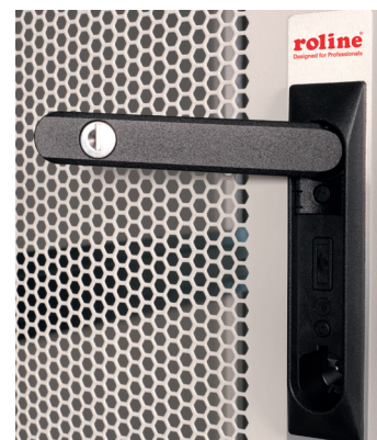
Verschluss-System mit Schwenkhebelgriff